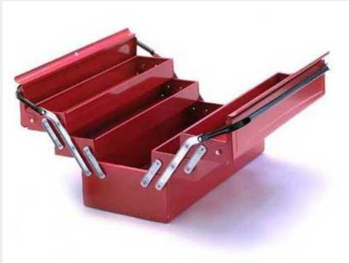
La boîte à outils